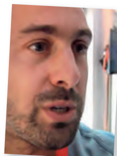
Mickaël GUIGOU (Handball)