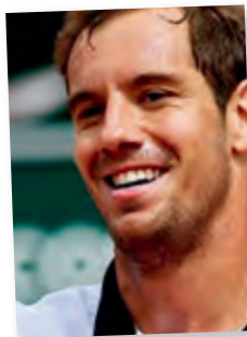
Richard GASQUET (Tennis)